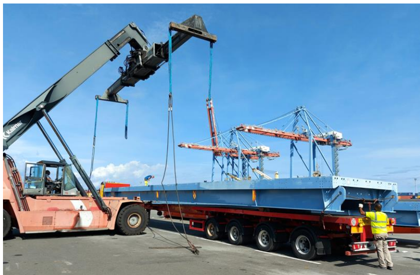
Le VMD (viaduc métallique démontable)